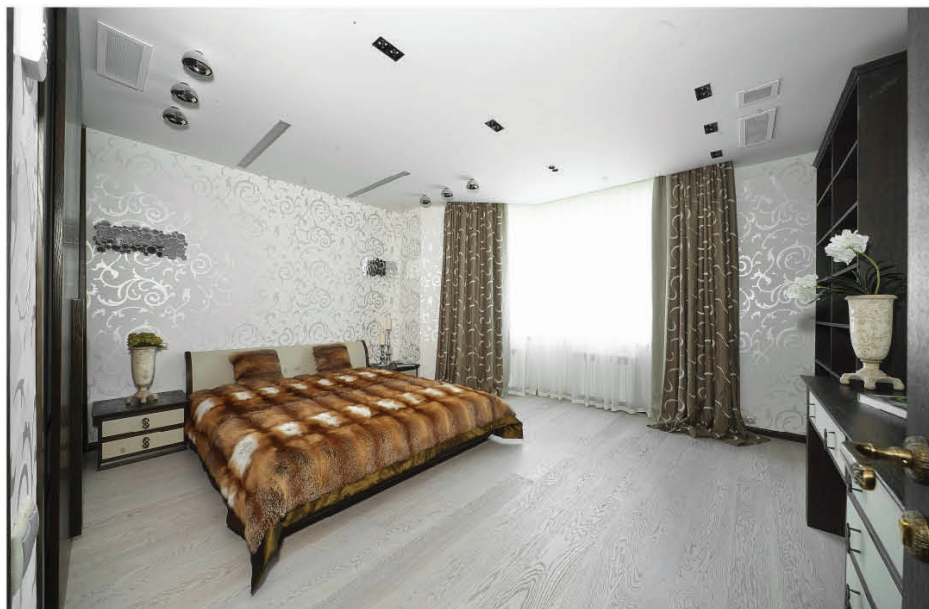
В спальне, обставленной мебелью Ego, крупный рисунок фактурной штукатурки Paritet с серебристым блеском повторяется в узорах пышных оконных портьер

Во вместительной ванной комнате современная душевая кабина Burg с прозрачными стенками и встроенная ванна, облицованная светлой керамикой, создают легкий контраст с деревянной мебелью Ego, в облике которой читаются мотивы ретро. Встроенные потолочные светильники DeltaLight обеспечивают мягкое, приятное освещение, способствующее релаксации